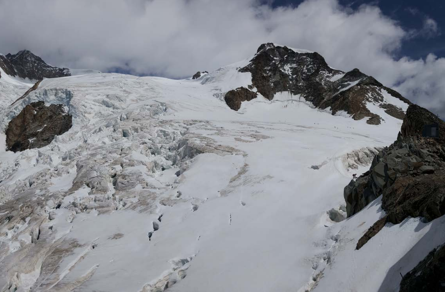
Pogled na ledenik Lys, gornike in Piramido Vincent